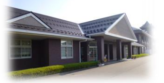
認知症対応型共同生活介護 エルピスホーム