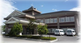
特別養護老人ホーム エルピス