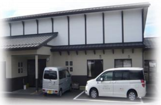
小規模多機能型共同生活介護 エルピス大東