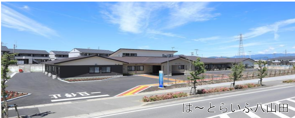
は~とらいふ八山田