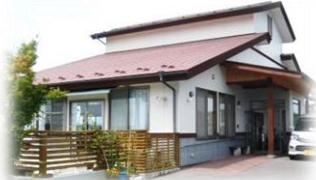
小規模多機能型共同生活介護 エルピス玉川