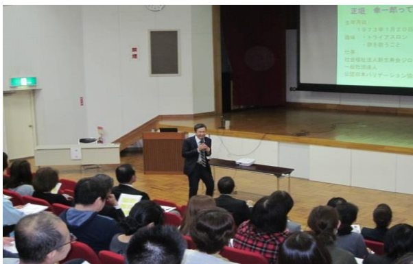
職員研修会の様子