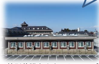
特別養護老人ホーム エルピス ユニット型