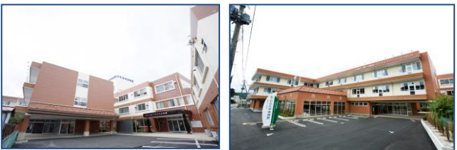
ひらた中央病院 (平田村 病床数142床)