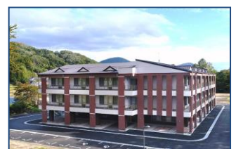
特別養護老人ホームさくらの里 (田村市滝根町 入所定員100)