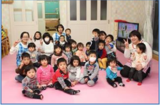
おひさま保育園 小さなお子さんがいる方も安心して働けます