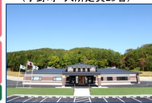
特別養護老人ホームかわうち (川内村 入所定員80名)