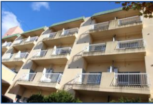
ひらた中央病院 職員寮