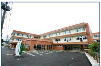
ひらた リハビリテーション・ケアセンター