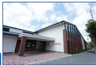
特別養護老人ホームさくら (小野町 入所定員29名)