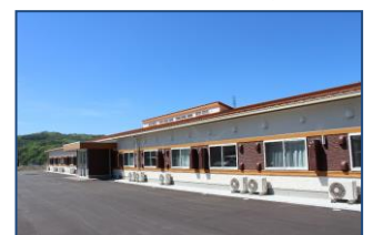
特別養護老人ホームかわうち職員寮