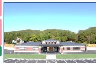
特別養護老人ホームかわうち