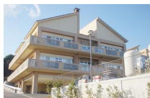
介護老人福祉施設 望洋荘