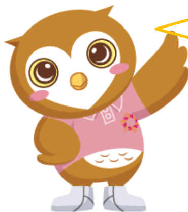
↑ 法人イメージキャラクター ふくふくちゃん