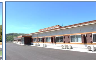
特別養護老人ホームかわうち