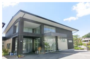
地域密着型介護老人福祉 施設

りんさく福祉会では、平豊間地区の「望洋荘」と 内郷御殿地区の「せんしょう苑」で 介護職員を募集しております。