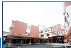
ひらた中央病院 (平田村 病床数142床)