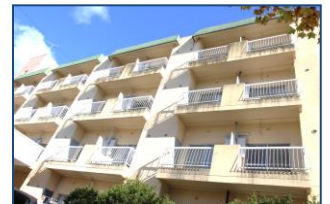
ひらた中央病院 職員寮