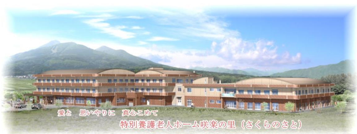
愛と 思いやりと 真心こめて